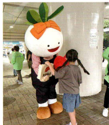
都田地区のキャラクター「みやこちゃん」も呼びかけを行いました!