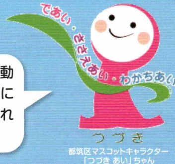
つづき 都筑区マスコットキャラクター 「つづき あい」ちゃん

誰もが安心して自分らしく健やかに暮らせる地域を目指し、地域の皆さん、活動する団体や組織、区役所・区社会福祉協議会・地域ケアプラザが、地域の課題解決に向けて協働して策定・推進する計画のことで、都筑区では地域の皆さんに親しまれるように「つづき あい」という愛称で読んでいるんだよ。