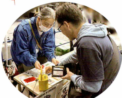
試合会場でたくさんの方から募金いただきました

11月9日、横浜ビー・コルセアーズ「都筑区応援Day」にて募金活動を行いました。当日は試合会場内に特設ブースを設けていただき、募金の呼びかけをさせていただきました。