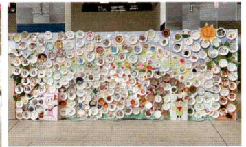
「推しおしつづき」をテーマに募集した紙皿アート作品の展示

また、今年度新たな取組として、ノースポートモールにて農福連携のPRも実施し、焼き芋や自主製品の販売等を行いました。