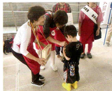
センター北駅での募金活動の様子