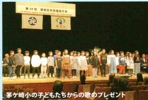
茅ヶ崎小の子どもたちからの歌のプレゼント