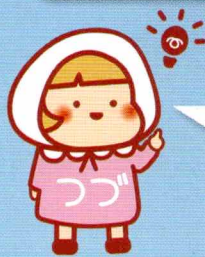
都筑区地域福祉保健計画 キャラクター つづちゃん

そうだね。地域の福祉保健の推進に向けて、“ であい ”が広まり、お互いに“ ささえあい ”、地域が持つ力を“ わかちあえる ”都筑区をめざした計画だよ! みんなで、こんな都筑区を目指しましょう! という「目指す姿」とそのためにそれぞれの立場で何ができるか具体的な取組みが載っているよ。