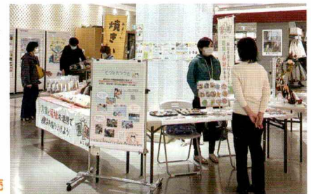
ノースポートモールでの販売

また、今年度新たな取組として、ノースポートモールにて農福連携のPRも実施し、焼き芋や自主製品の販売等を行いました。