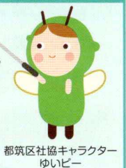
都筑区社協キャラクター ゆいピー

日本赤十字社では、令和7年度より講習資材の配送サービスを開始しました。このサービスの導入により、これまで以上に手軽に、救命法などの各種講習を開催いただけるようになりました。講習内容は、 心肺蘇生法やAEDの使用法を学ぶコース をはじめ、 身近な物を活用した応急処置を学ぶコース など、複数のモデルコースの中から、ご希望に応じて選択することができます。開催場所をご用意いただければ、 講習にかかる費用負担はありません 。なお、講習開催には事前のお手続きが必要となります。開催を希望される地域の皆さまは、都筑区社会福祉協議会までお気軽にご相談ください。