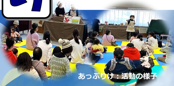
あっぷりけ：活動の様子