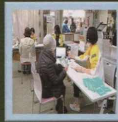
健康チェックコーナー