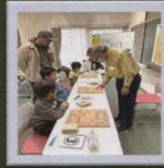
みんなの将棋コーナー