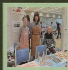
おもちゃPARK：木のおもちゃ：布のおもちゃ