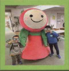
写真：昨年のまつりの様子 ミニ工作教室