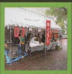
焼きそば・綿あめ販売