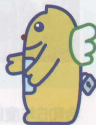
明推協のキャラクター めいすい君

約1票差で当落が変わる選挙があることを知っていますか？ 毎年いくつかのケースがありますが、令和5年に行われた選挙では、新宿区議会議員選挙（0.299票差）、世田谷区議会議員選挙（1.307票差）などがあります。1票を無駄にせず、しっかりと政治に声を届けていきたいですね。