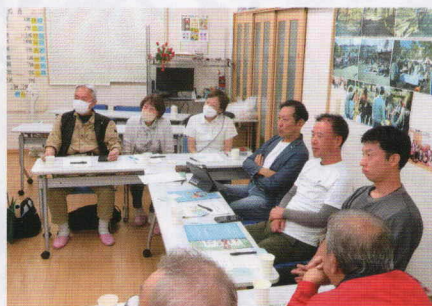
■荏田東2丁目自治会 多世代が参画する居場所づくり