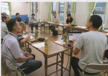
■勝田南町内会 広報活動の電子化