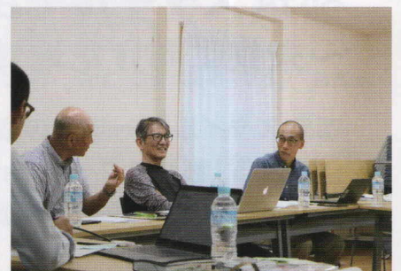
■牛久保町内会 新しいイベントの企画と担い手発掘