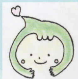
都筑区青少年指導員連絡協議会 イメージキャラクター「つづきキズナ」