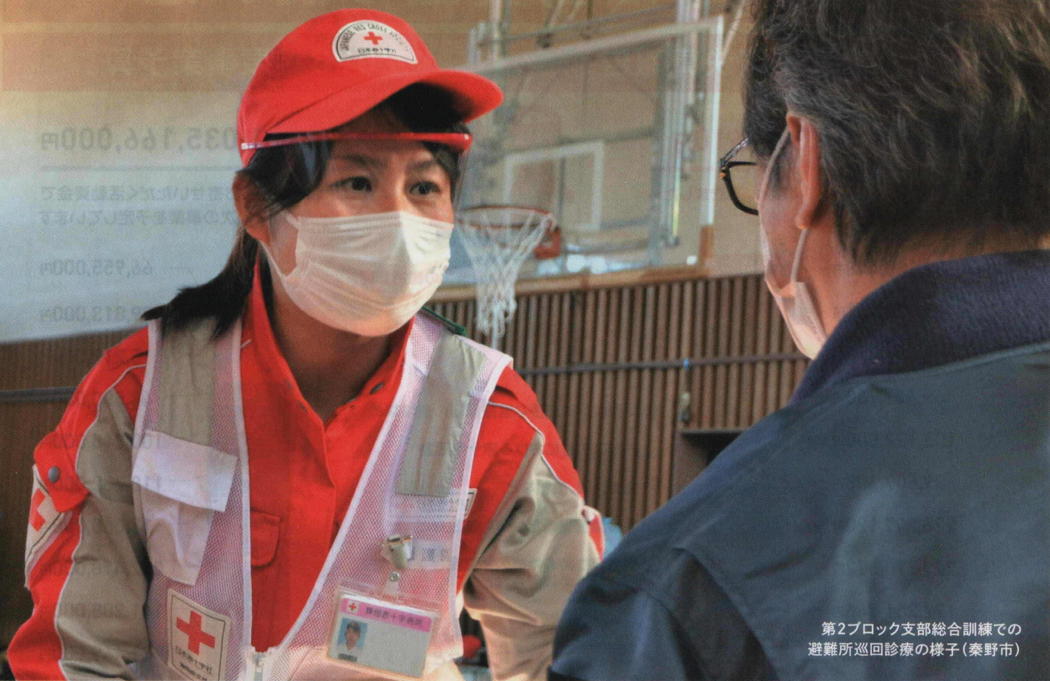
第2ブロック支部総合訓練での 避難所巡回診療の様子(秦野市)