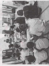
子ども食堂・ふれあいっこ三ツ沢 (横浜市神奈川区)