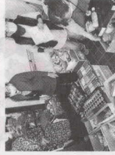
小田原市母子寡婦福祉会 / ひとり親世帯への食料品支援 (小田原市)