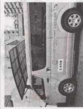
(福)ともかわさき・むぎの穂 / 福祉車両整備 (川崎市川崎区)