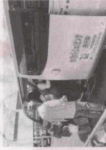
買い物支援わくわく・シヨッピング (大井町協協)