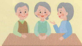
サロン・居場所づくり