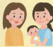
子育て・子ども支援