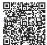
サポカー限定免許で運転できる車

お持ちの運転免許にサポートカー限定条件を付与すると、運転できる対象車両を安全運転サポートカー（サポカー）に限定することができます。試験等はありません。普通免許をお持ちの方であればどなたでも条件の付与が可能です。