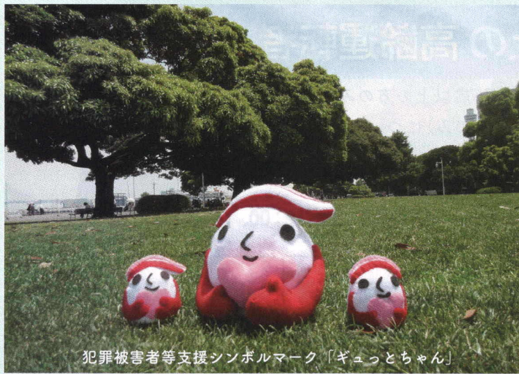
犯罪被害者等支援シンボルマーク「ギョっとちゃん」

かながわ犯罪被害者サポートステーションは、神奈川県・県警察・認定特定非営利活動法人神奈川被害者支援センターの三者が一体となって、法律相談やカウンセリング等の総合的な支援を行っています。