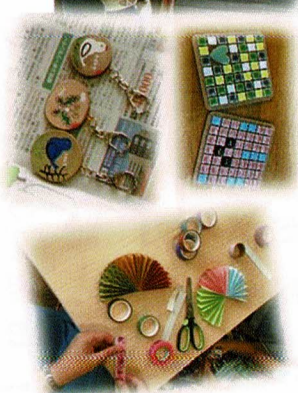
素敵な作品ができました