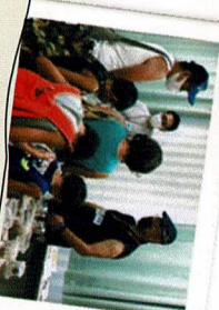
昆虫テーマーさんの販売