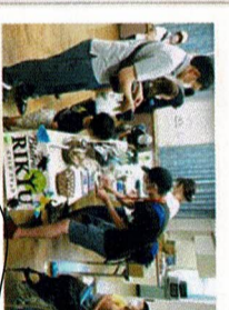
昆虫食販売・試食