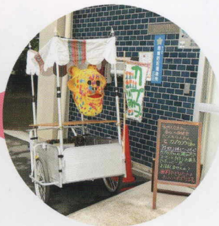
お手製のアートリヤカーで出張