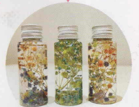
子どもたちと制作したハーバリウム