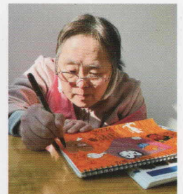
唯一無二のアート作品が日々生まれています