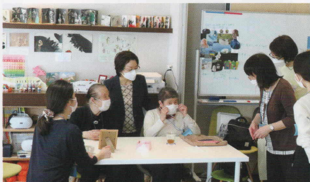
「アーモンド・カフェ〜スープの時間〜」では、楽しい活動と野菜スープストックランチを提供