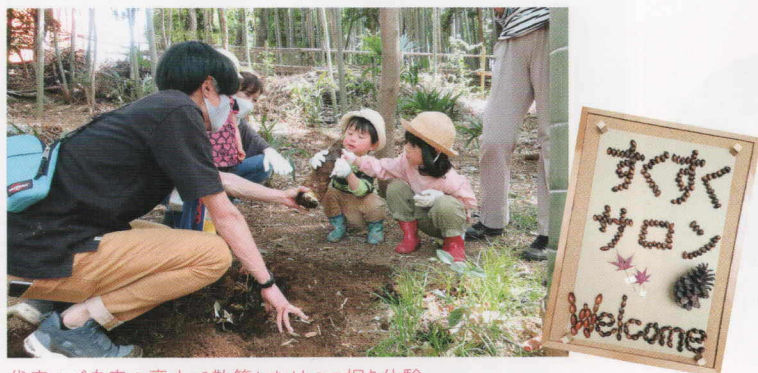
代表のご自宅の裏山で散策とたけのこ掘り体験