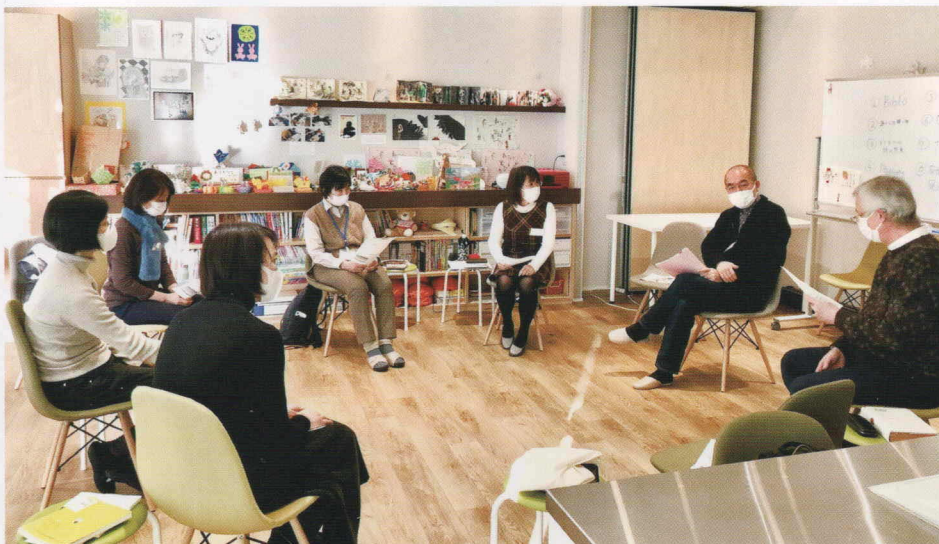
対話によるこころの支援を行うみなさんの傾聴勉強会の様子