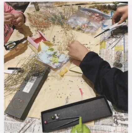
北山田と川和町で学び直しとアート制作活動等を実施しています