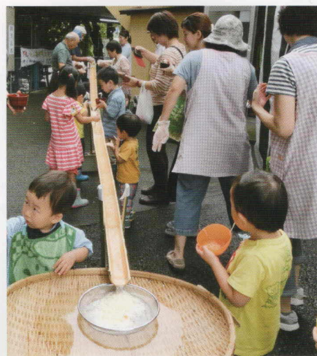
地元の自治会館で老人会のみなさんと流しそうめんを実施