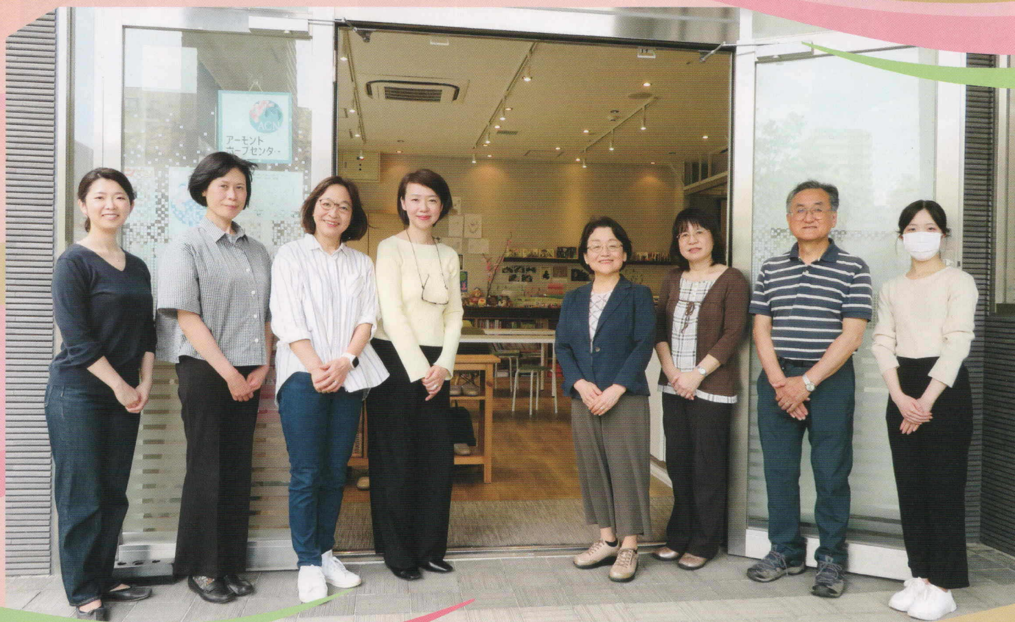
アーモンドコミュニティネットワーク:対話によるこころの支援を行うみなさん

都筑区では、様々なNPO法人が専門分野やテーマに いかり 錨「ANCHOR」を下ろし、地域課題に取り組んでいます。 彼らの活動の中での工夫やアイデア、自治会町内会等と協力して いる事例も含め、その魅力的な取組をご紹介します。