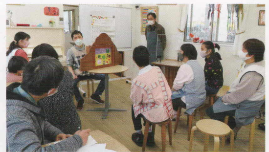
カフェではピアノコンサートや紙芝居を不定期で開催 カプカプ流おもてなしをお楽しみください