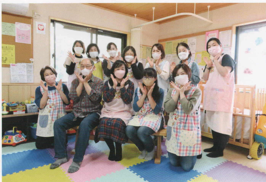
親と子のつどいの広場「すくすくサロン」のスタッフのみなさん