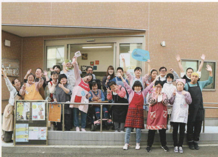
平日の11時から18時まで営業 どなたでもお気軽にお立ち寄りください！